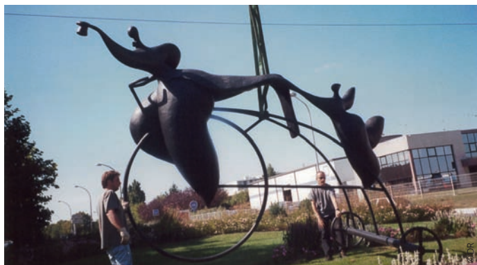
Installations de La Walkyrie boulevard de l'Entre-deux-Mers et du Grand bi au rond Jean Zay pour les Journées européennes du patrimoine