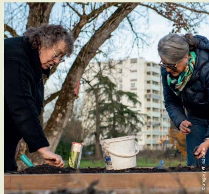
L'ancienne friche est devenue le jardin d'Henri.

L'aménagement paysager prévoit la création de cheminements piétons, la plantation d'arbres et l'implantation d'un jardin potager en connexion directe avec le Jardin d'Henri (ex-Friche Sellier). Seule une clôture légère viendra matérialiser la limite entre les deux jardins (domaine public et domaine privé). Un portillon reliera les deux espaces afin de permettre une mutualisation des outils (stockage, compostage) et un échange de pratiques et de savoirs entre jardiniers. Enfin, sous réserve de l'absence de pollution des sols, un verger viendra en prolongement de l'entrée principale donnant sur la rue Anatole France.