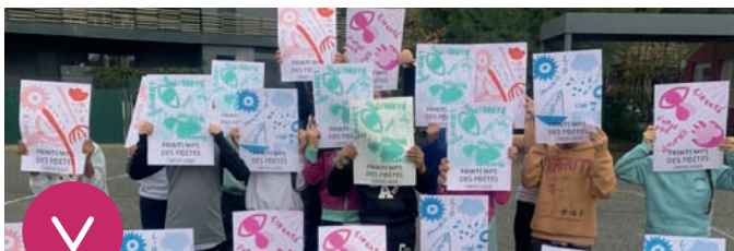
© CCEZ - CMI de Marion Darricau, école J. Guedes.