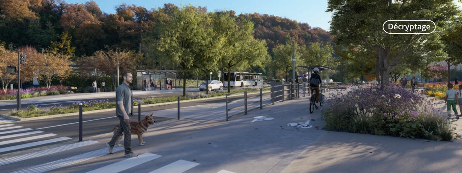
Projet d'aménagement du boulevard de l'Entre-deux-Mers. @Spectrum Immersive Architecture.