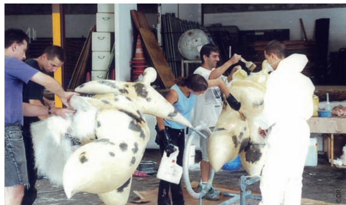
Atelier de fabrication aux services techniques municipaux, avec le renfort d'agents et d'habitants.

En 2026, le charme des sculptures cenonnaises opère comme au premier jour. Elles sont à voir sur le parvis de la Mairie, devant l'accueil de l'Hôtel de ville, sur la place de la Morlette, à l'entrée du stade d'athlétisme Henri Danflous.