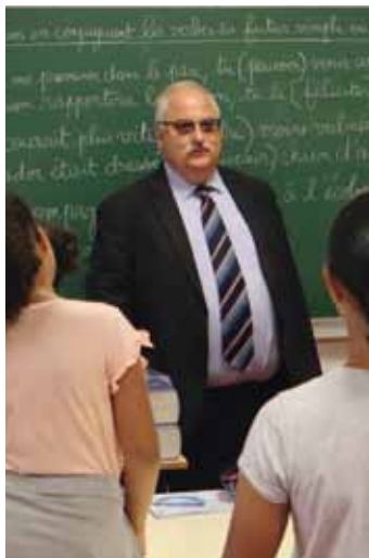
M. le Maire, lors de la remise des dictionnaires aux élèves quittant le CM2 pour le collège

Cenon attire : des habitants, des familles s'installent... L'accueil scolaire et extrascolaire doit s'adapter. Pour orienter notre gestion et nos choix stratégiques, nous avons lancé une étude prospective. Il s'agit de nous doter d'un schéma directeur scolaire et extrascolaire pour les années à venir.