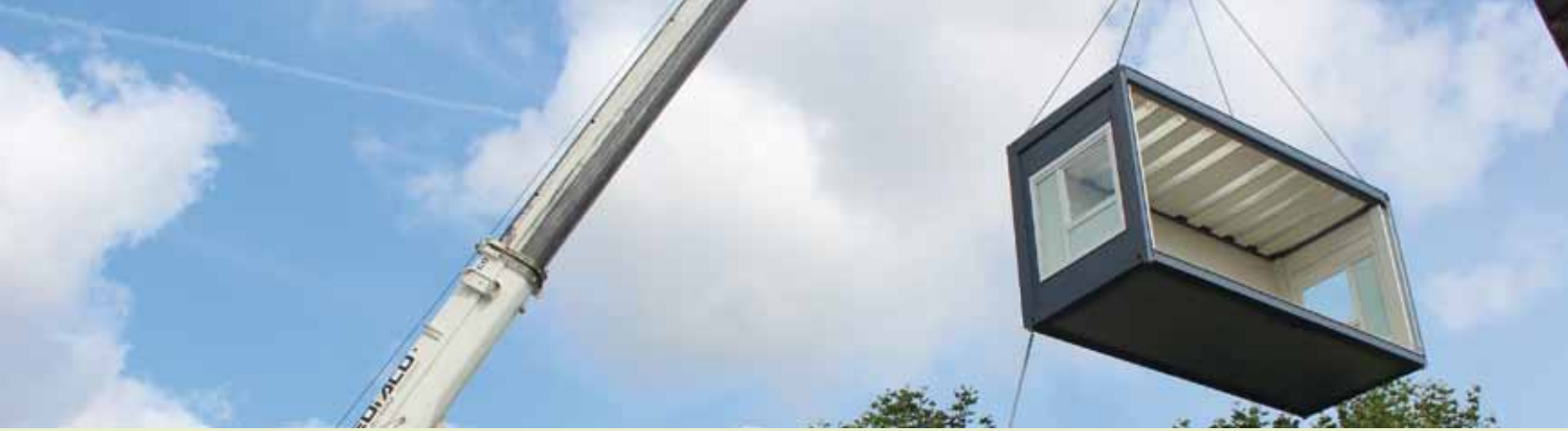
Livraison « par les airs » des modulaires à l'école Camille Maumey