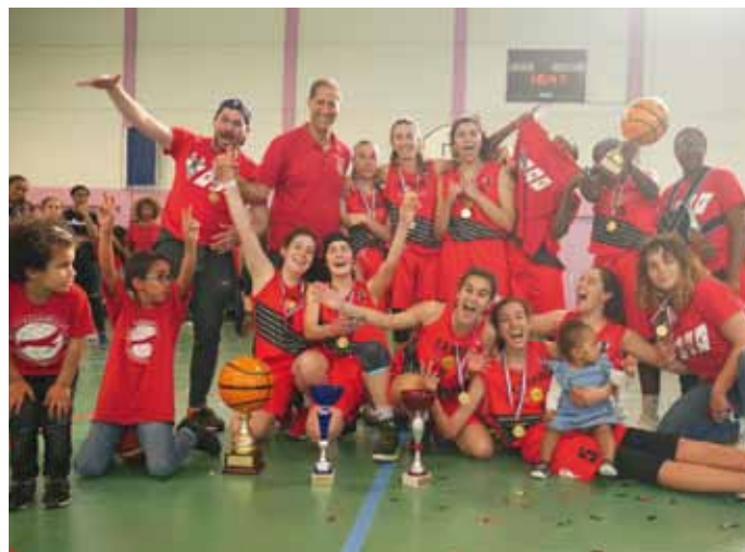
Seniors filles de l'US Cenon Basket : des filles en or !

L'école (6-9 ans) du Handball club municipal Floirac Cenon a reçu le Label OR du Comité de Gironde. Quant aux moins de 18 ans évoluant au sein de l'Union Bordeaux-Floirac-Cenon, ils sont qualifiés pour disputer le championnat de France 2020.