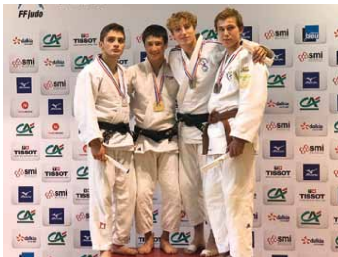
Une avalanche de podiums et de médailles pour l'US Cenon Judo