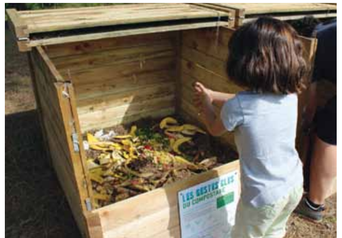
Après Triboulet, un second composteur est attendu à La ré d'eau

Au terme de l'année scolaire, la Fédération des Francas a accordé le label « centre A'ERE » à l'accueil périscolaire.