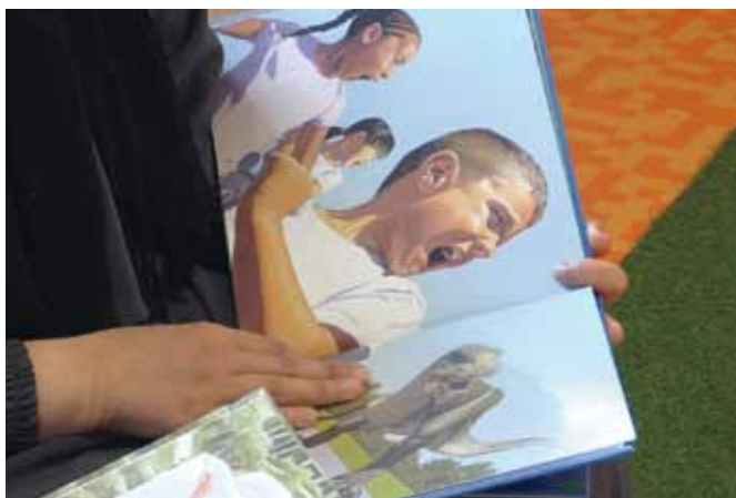
Des livres sans texte, pour raconter avec ses propres mots l'histoire illustrée

entrent très facilement dans les histoires, sans aide... C'est une très bonne entrée dans le monde de la lecture... »