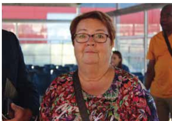
Madame l'Adjointe au maire, déléguée à l'Education

Je veux remercier l'ensemble des agent-e-s qui ont œuvré pour que les 17 écoles de Cenon puissent accueillir leurs élèves le 2 septembre dans des classes nettoyées, rénovées, dédoublées (pour les CP et les CE1), sécurisées. Tous les services publics municipaux se sont impliqués et chaque maillon de cette chaîne de compétences s'avère indispensable.