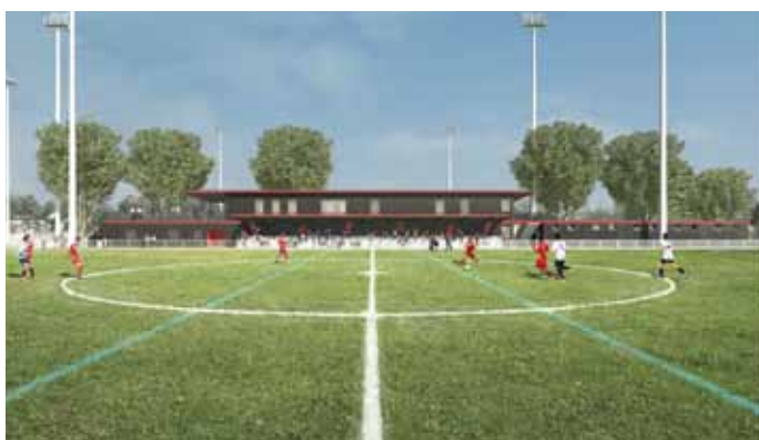
Terrains synthétiques, en gazon naturel, une tribune de 150 places.