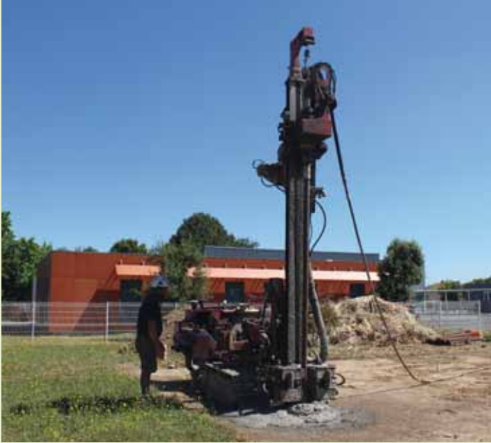
Fondations pour l'accueil d'un modulaire à l'école René Cassagne

RESPONSABLE DU SERVICE « PROJETS CONSTRUCTION », AGENTE DES ÉCOLES MATERNELLES, ANIMATRICE FRANCAS, COORDONATRICE DES MOYENS GÉNÉRAUX AU SERVICE EDUCATION... ELLES SONT DES MAILLONS ESSENTIELS AU BON FONCTIONNEMENT DE LA VIE SCOLAIRE ET AU BIEN-ÊTRE DES ÉLÈVES.