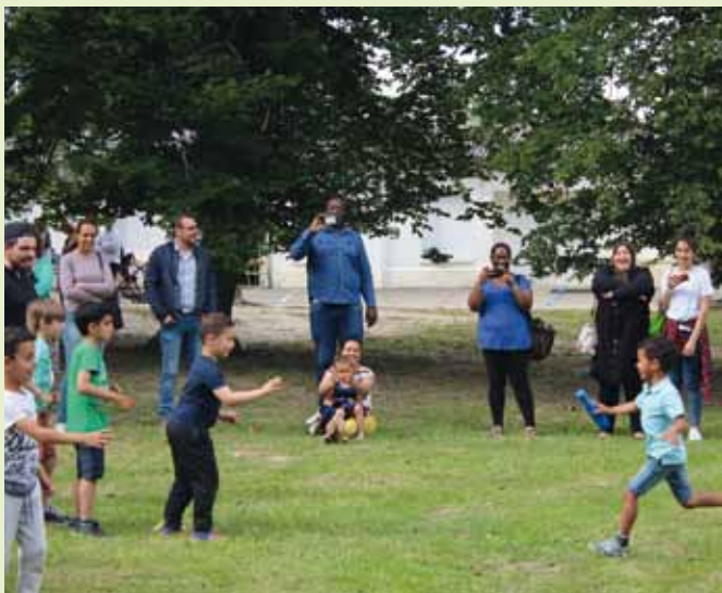
Décakids : course de relais devant les parents - supporters